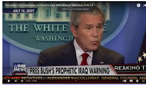
George Bushs Iraq Withdrawal Warning den 12 juli 2007

Det undertecknade Status of Forces Agreement avtalet som Bush hade upprättat 2008 föreskrev att de amerikanska stridsstyrkorna succesivt skulle dra sig tillbaka från de irakiska städerna, och den 31 december 2011 då skulle alla amerikanska stridsstyrkor ha lämnat Irak. Dock märk väl, om så då, var lämpligt. Det var planen. Avtalet var naturligtvis utformat att kunna förlängas.