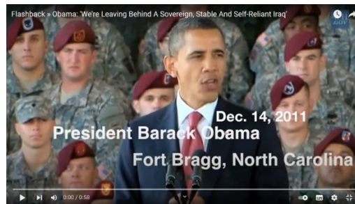
We are leaving behind a Sovereign, Stable and Self-Reliant Iraq

Barack Obama struntade således i att förlänga Status of Forces Agreement avtalet. Detta i syfte att vinna presidentvalet, med följd att precis som väntat - problemet IS skapades och, att Europas största flyktingkris sedan andra världskriget skapades. Men tack vare MSM & vårt public service partiska verksamhet så visste inte svenskarna om hur det i själva verket låg till. Förmodligen inte de övriga européerna heller för den delen. Endast Obamas rådgivare och vi som noggrant följde med utvecklingen kände till hur saker och ting låg till och vad som i själva verket ägde rum. Skälet till att MSM & vårt public service undanhöll informationen var naturligtvis partiskt förankrat. - Obama skulle ju vinna valet. Svenskarna fick med detta, genom vårt public service partiska verksamhet, som de ville. Precis exakt, som de ville.