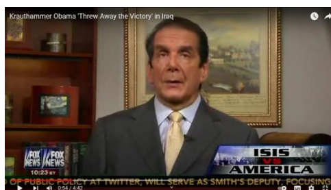
Krauthammer: Obama 'Threw Away the Victory' in Iraq