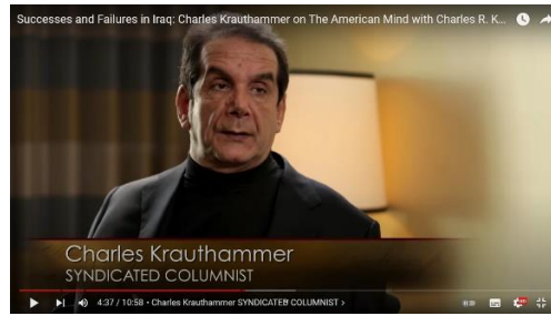
Charles Krauthammer Syndicated Columnist