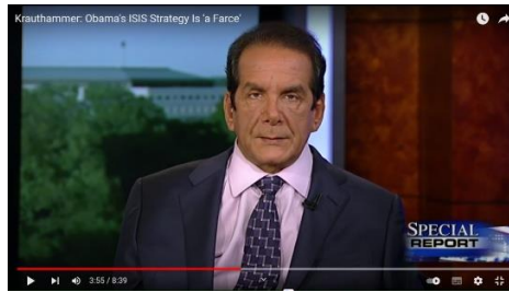
Obama's strategy is a farce and it works just as it is designed (3:40 I på videon)