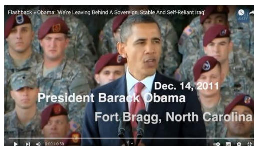
We are leaving behind a Sovereign, Stable and Self-Reliant Iraq

I samband med att Obama december 2011 drog tillbaka de sista trupperna från Irak klargjorde en utomordentligt tacksam president Obama i sitt tal förnöjt och rakt av att han ärvt ett "suveränt, stabilt och självständigt Irak som nu har en representativ regering vald av sitt eget folk".