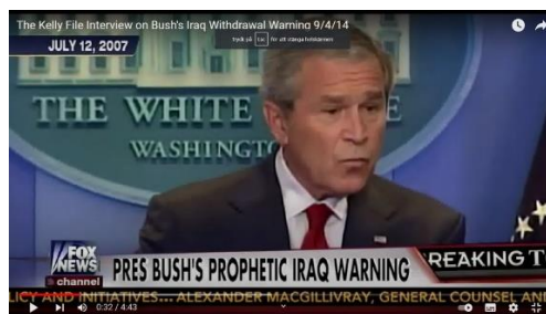
George Bushs Iraq Withdrawal Warning den 12 juli 2007

Irakkriget var en framgång, en fullständigt fenomenal framgång, vilken den nyvalde presidenten Barack Obama bara hade att hålla sig fast vid och ro i land.