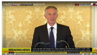
Tony Blair Responds To The Iraq Inquiry Report