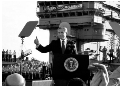
George W. Bush ombord på USS Abraham Lincoln

2003-05-01. När soldaterna på det amerikanska hangarfartyget USS Abraham Lincoln hade slutfört sitt föreskrivna uppdrag på själva hangarfartyget då flög George W. Bush dit. Och väl ombord på USS Abraham Lincoln då höll Bush ett tacktal till soldaterna för att de rott i land det uppdrag de beordrats att utföra. Utan Bushs vetskap hade soldaterna på USS Abraham Lincoln satt upp en banderoll som löd "Mission accomplished" med innebörd av att soldaternas uppgift på själva USS Abraham Lincoln var slutfört. I talet gjorde George W. Bush helt klart att svårt arbete fortfarande återstod och att arbete med att säkra farliga delar av Irak fortfarande stod kvar, osv. Bush förklarade också i talet att övergången från diktatur till demokrati nu kommer att ta tid, men att USA och dess allierade har för avsikt att stanna kvar fram till dess att jobbet är fullgjort. SVT:s rapporter har vid upprepade tillfällen med hjälp av trixiga klipp medvetet gjort narr av Bush genom att måla ut den alltigenom felaktiga bilden att president Bush här på hangarfartyget USS Abraham Lincoln påstod och därmed också själv trodde att Irakkriget var över. SVT:s agerande är i det här fallet direkt brottsligt, enligt min mening.